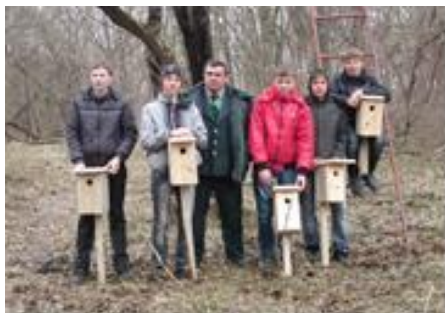
Развешивание искусственных гнездовий