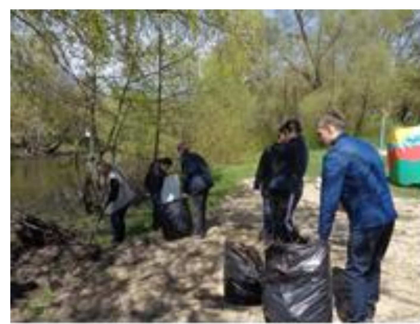
Участие в акции «Дни защиты от экологической опасности»

Станцией юных натуралистов совместно с общеобразовательными учреждениями были реализованы экологические проекты: «Благоустройство родников и озеленение оврагов на территории района», «Создание геоинформационной базы родников». В результате было благоустроено 17 родников, высажено 3500 саженцев деревьев и создана геоинформационная база, включающая 90 родников Волоконовского района.