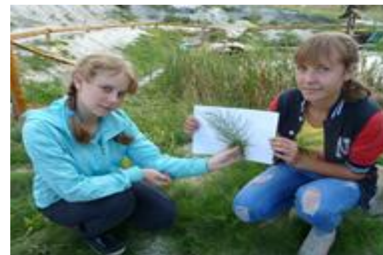
Определение флоры водоема

Формы работы разнообразны: беседы, праздники, игры, экскурсии, проектная, исследовательская и природоохранная деятельность.