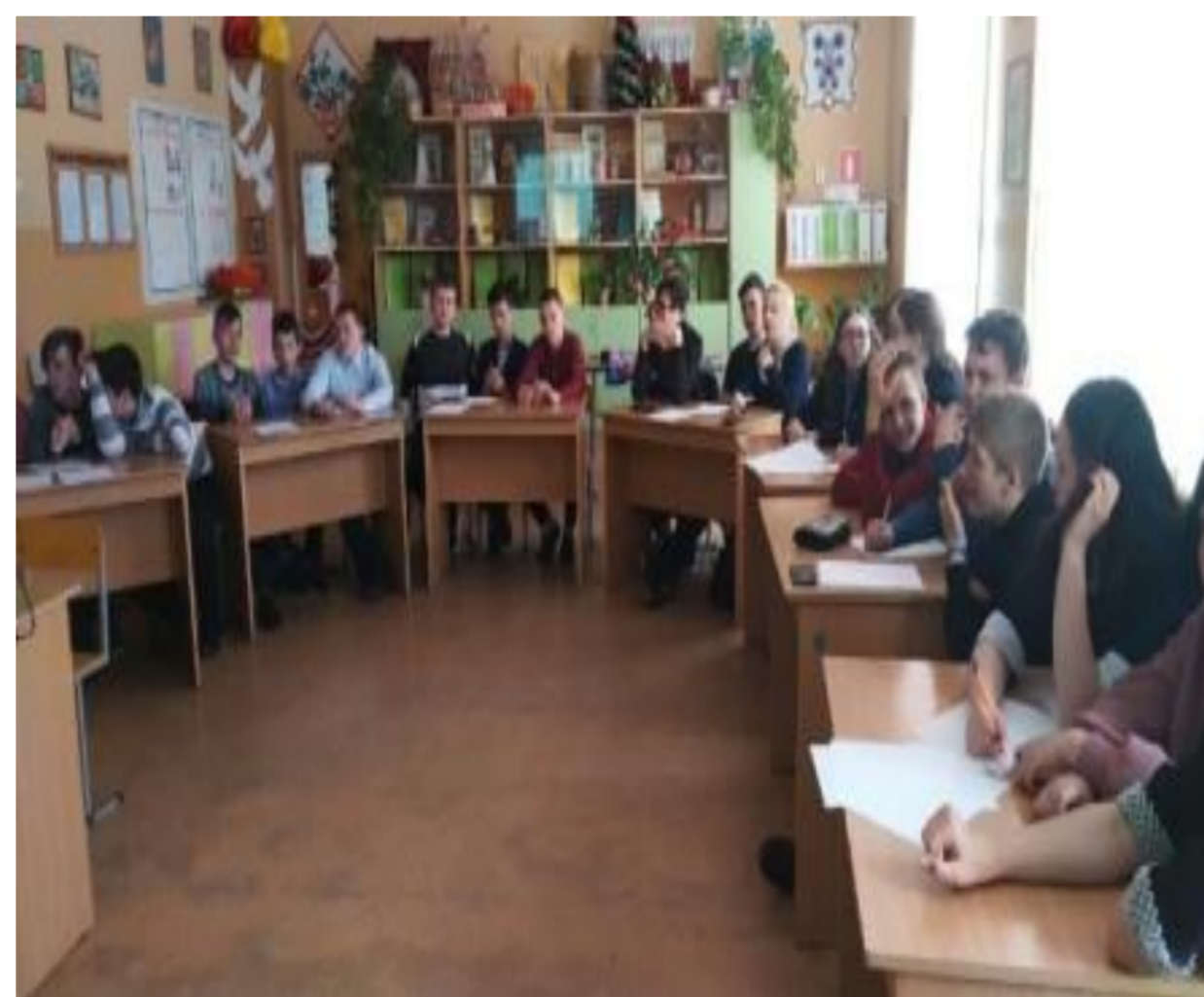
Проведение бесед с обучающимися