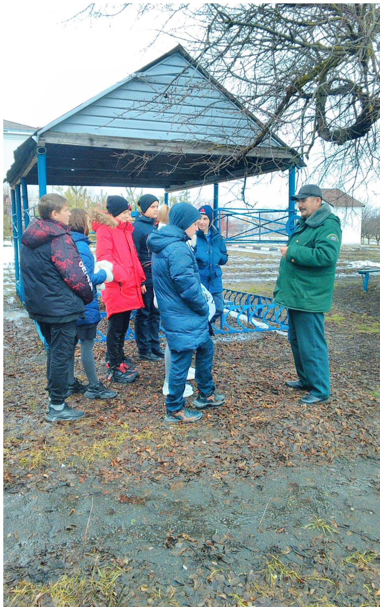
Встречи со специалистом Волоконовского лесничества

В акции приняли участие в акции- 1073 человек из них-1055 обучающихся 18-педагогов